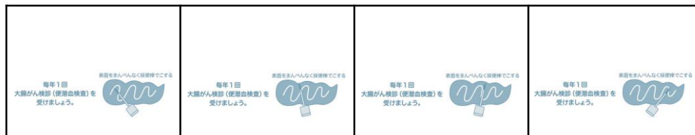
↑採便方法をパラパラまんがで再現