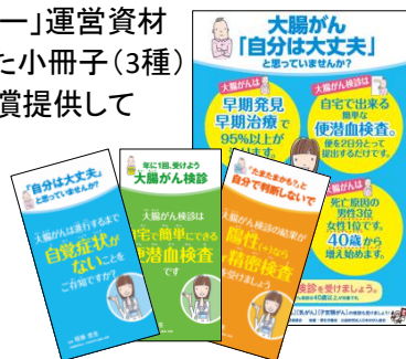
大腸がん検診について分かりやすくまとめた小冊子・ポスター