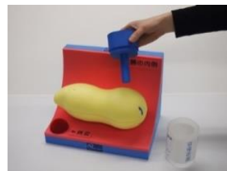
「大腸がん検診べん君」 採便方法を説明する模型の 有料レンタル