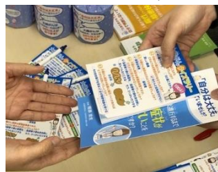
楽しみながら大腸がんについて学べる「大腸がんクイズラリー」