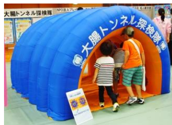
「大腸トンネル探検隊」 「大腸がんクイズラリー」と一緒に使用し、 来場者を呼び込む資材の有料レンタル