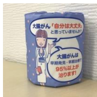
トイレで大腸がん検診を呼びかけるトイレトーパー販売