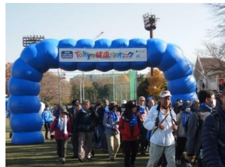
「Tokyo健康ウォーク2017」開催