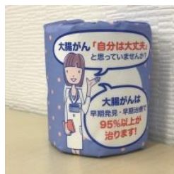
個別包装紙にもメッセージを掲載